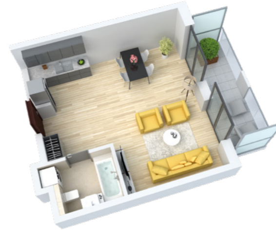
Mieszkanie 1-pokojowe o powierzchni 40,68 m 2