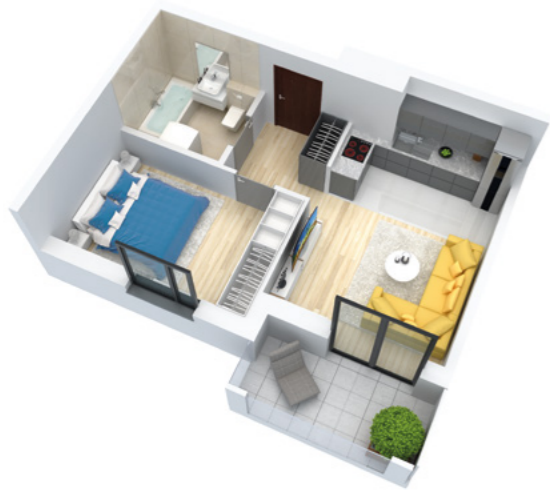
Mieszkanie 2-pokojowe o powierzchni 36,56 m 2