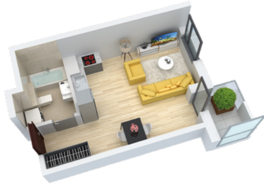
Mieszkanie 1-pokojowe o powierzchni 31,05 m 2