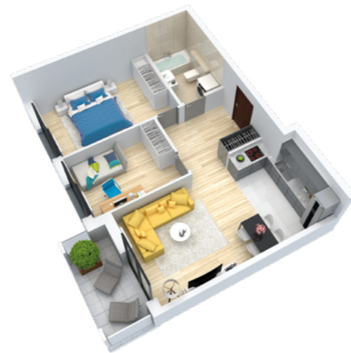
Mieszkanie 3-pokojowe o powierzchni 57,81 m 2