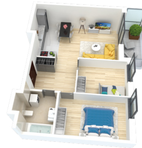
Mieszkanie 3-pokojowe o powierzchni 58,25 m 2