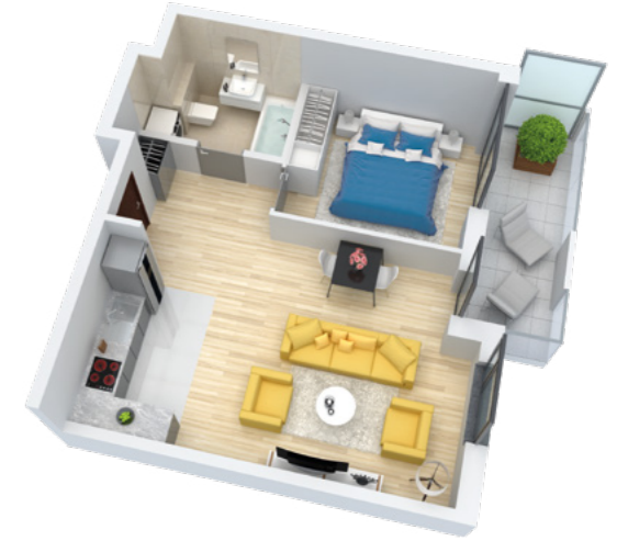
Mieszkanie 2-pokojowe o powierzchni 45,61 m 2