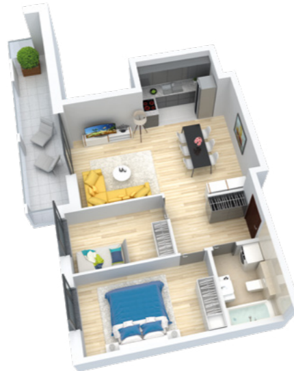
Mieszkanie 3-pokojowe o powierzchni 59,54 m 2