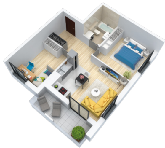
Mieszkanie 3-pokojowe o powierzchni 54,81 m 2