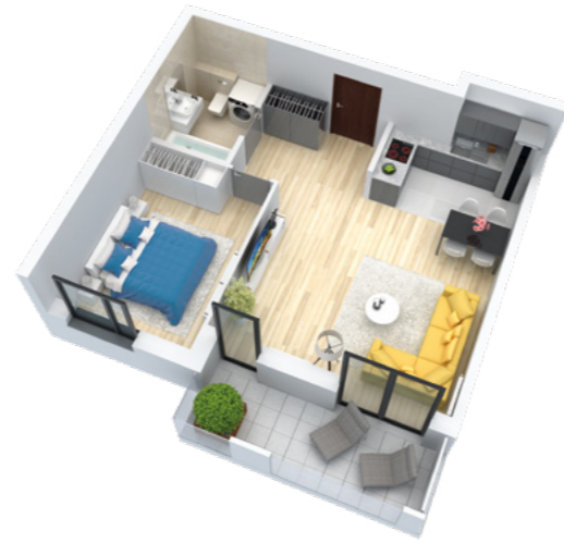
Mieszkanie 2-pokojowe o powierzchni 48,35 m 2