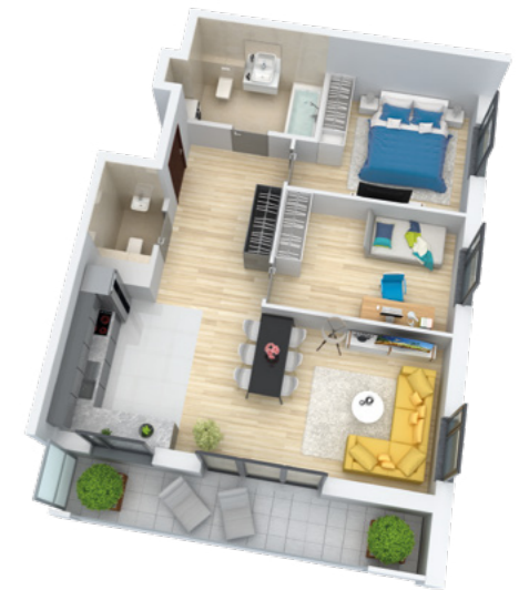
Mieszkanie 3-pokojowe o powierzchni 75,99 m 2