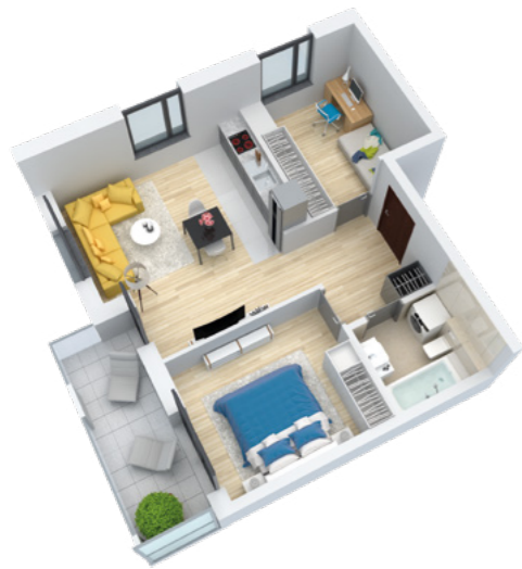
Mieszkanie 3-pokojowe o powierzchni 52,99 m 2