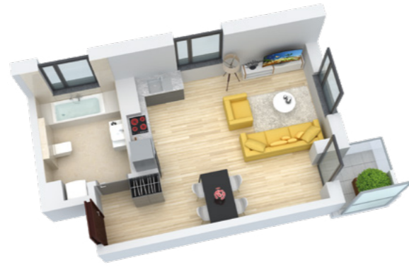
Mieszkanie 1-pokojowe o powierzchni 36,63 m 2